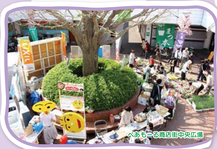
ペあもーる商店街中央広場