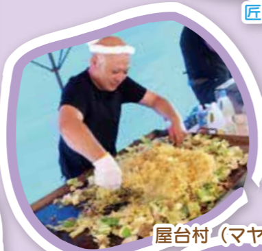
屋台村 (マヤマ茶屋)