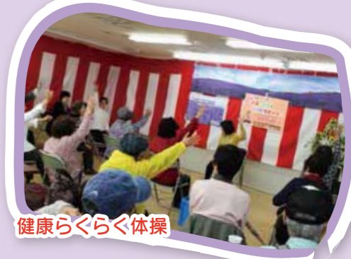
健康らくらく体操