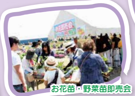
お花苗・野菜苗即売会