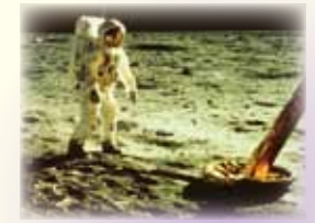
アポロ計画 人類が初めての月面着陸