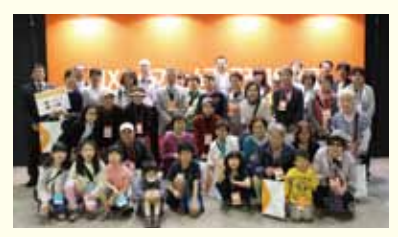
リクシル展示会ビックサイト見学& 横浜中華街観光ツアー開催

様々なイベントから沢山のお客様との絆を作り、信頼をもらい、多くのお仕事をさせて頂いております。