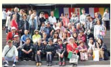
小江戸川越散策ツアー開催