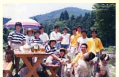
旧マヤマスタッフ

本当に今あるのは全ての方々の出会いのおかげです。ありがとうございます。昭和、平成、そして新元号「令和」と3つの時代に生かされ感謝です。これからも、「店はおお客様の為にあり」の初心を忘れず息子の時代になりこれからは全ての人々から「ありがとう!」をいっぱい頂く事を生きがいとし、皆様のお役に立ちたい想いで日々を送らせて頂きたい、これからも宜しくお願い致します。