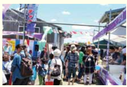
年に一度の大イベント 「我楽多市」

ITやロボットなどで、私達の生活が便利で助かることも多くなった今ですが、マヤマが創業当時から変わらぬ想いがあります。それは「人と人の暖かいふれあいを大切にする」と言う事です。お客様との趣味の話、お子様の成長の話、ペットの話などを聞くと心が暖かくなります。これからも、お客様と共に人生を楽しむことが出来れば最高の想いです。