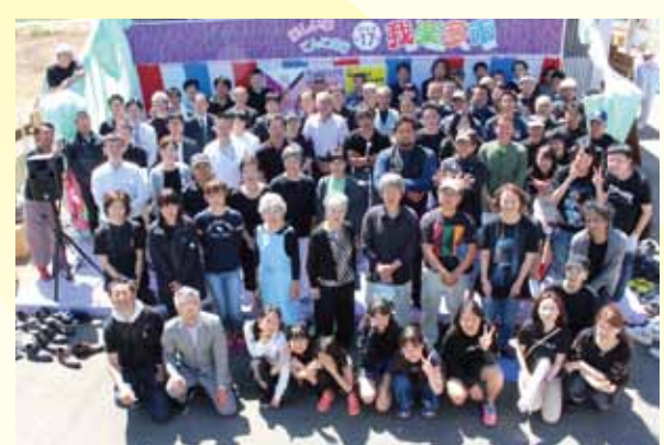
現マヤマスタッフ及び職人チームマヤマ倶楽部