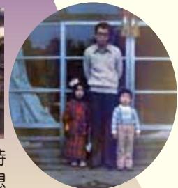
今福661番地明見院前にて

日本が列島改造へと盛り上がり初めた熱き時代の中「とにかく頑張ればいい明日が来る」想いの北海道出身の2人でした。